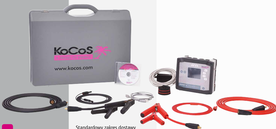
Standardowy zakres dostawy